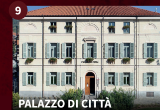
9 PALAZZO DI CITTÀ

Rado, prima del 1242, anno di fondazione del Borgo, era la località più importante della zona e la Chiesa è già citata prima dell'anno Mille. Acquistò grande fama come Santuario Mariano, che i fedeli raggiungevano per onorare la Madonna Nera, la cui statua lignea risalente al secolo XV è ancora oggi esistente.