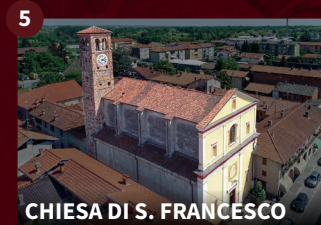
5 CHIESA DI S. FRANCESCO

Sul culmine di una delle più alte colline a nord di Gattinara, a 540 m s.l.m., sono situati i ruderi del Castello di S. Lorenzo, costruito nel 1187 dal Comune di Vercelli a guardia delle bocche della Valsesia e progressivamente abbandonato tra XVI-XVII secolo. È uno dei punti panoramici più conosciuti della Città.