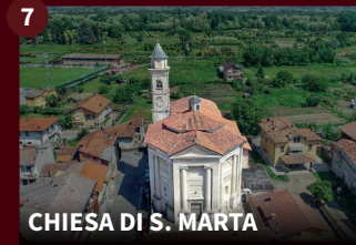
7 CHIESA DI S. MARTA

Sul posto esisteva, ancora prima della fondazione del Borgo del 1242, un'antica cella monastica dedicata a San Benedetto. In seguito venne costruita l'attuale Chiesa di forme barocche che prese il nome di "Maria Vergine Regina del S.S. Rosario". La facciata risale al 1688. All'interno, sopra un sontuoso altare di marmo nero, è collocato un trittico attribuito al Giovenone.