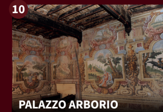
10 PALAZZO ARBORIO

Attuale sede del Municipio, nata come residenza dei marchesi Arborio Gattinara dal progetto dell'Architetto gattinarese Delmastro.