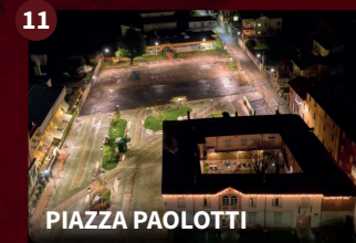
11 PIAZZA PAOLOTTI

Caratteristica costruzione di fine '800 con una magnifica corte interna ombreggiata da un tiglio secolare, oggi è sede dell'Enoteca Regionale, dell'Ecomuseo e ospita una importante sala conferenze adiacente allo spazio espositivo G'ART.