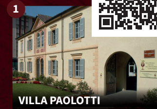
1 VILLA PAOLOTTI

Edificato intorno al 1450, vi lavorarono frescantì di scuola novarese come Pietro da Novara, Angelo Canta e Daniele de Bosis. In età napoleonica venne frazionato tra privati. Un'ala, ora sede dell'Associazione Culturale di Gattinara, conserva pregevoli affreschi e soffitti a cassettoni ed è visitabile su richiesta. Per informazioni: associazioneculturaledigattinara.it