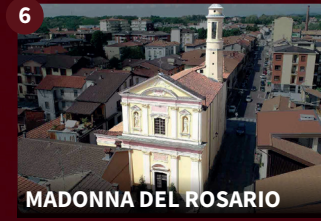
6 MADONNA DEL ROSARIO

Nel 1619, sulle rovine della Chiesetta di San Giulio, iniziarono i lavori per edificare la Chiesa di San Francesco e il convento dei Frati Minori. La facciata della Chiesa costituisce un esempio di architettura del primo, sobrio, barocco. All'interno esiste un altare ligneo, intagliato, di pregevole fattura.