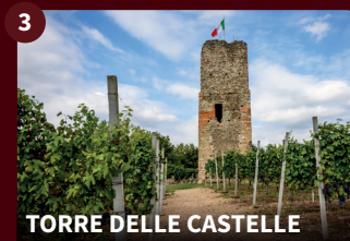
3 TORRE DELLE CASTELLE

L'edificio romanico a tre navate fu abbattuto intorno al 1470 e fu ricostruita una Chiesa in forme tardo gotiche su quattro navate, di cui restano oggi la facciata e la base del campanile. L'attuale Chiesa fu edificata nel 1881 con forme neoclassiche. La cupola è tra le prime costruzioni italiane in laterizio armato.