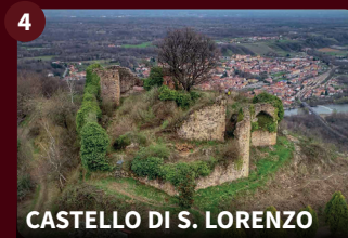
4 CASTELLO DI S. LORENZO

La massiccia Torre delle Castelle, simbolo della Città, risalente all'XI secolo, è la parte più evidente di un importante complesso fortificato medievale. Offre un panorama splendido sulla catena del Monte Rosa e sul territorio circostante.