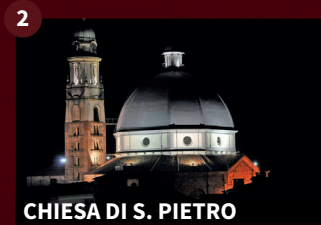
2 CHIESA DI S. PIETRO

L'edificio romanico a tre navate fu abbattuto intorno al 1470 e fu ricostruita una Chiesa in forme tardo gotiche su quattro navate, di cui restano oggi la facciata e la base del campanile. L'attuale Chiesa fu edificata nel 1881 con forme neoclassiche. La cupola è tra le prime costruzioni italiane in laterizio armato.