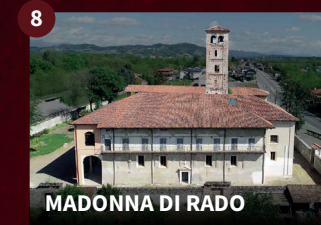
8 MADONNA DI RADO

Costruita dopo il 1450, nel 1844 venne rifatta come appare ora, con facciata neoclassica e colonne ioniche. L'edificio attuale a pianta centrale viene oggi utilizzato per concerti musicali per la buona acustica.