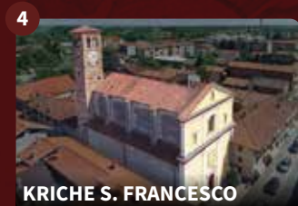
KIRCHE S. FRANCESCO

Auf dem Gipfel eines der höchsten Hügel nördlich von Gattinara liegen 540 m ü.M. die Ruinen der Burg S. Lorenzo, die 1187 von der Gemeinde Vercelli zur Bewachung der Mündung des Sesiatals errichtet und allmählich zwischen dem 16. und 17. Jh. verlassen wurde. Sie ist einer der bekanntesten Aussichtspunkte der Stadt.