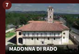
MADONNA DI RADO

Sie wurde nach 1450 erbaut und 1844 in ihrer heutigen Form mit einer klassizistischen Fassade und ionischen Säulen umgebaut. Das heutige Gebäude mit zentralem Grundriss wird wegen seiner guten Akustik für Musikkonzerte genutzt.