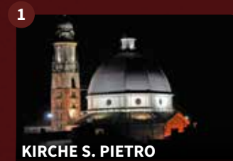
KIRCHE S. PIETRO

Das dreischiffige romanische Gebäude wurde um 1470 abgerissen und an ihrem Standort eine vierschiffige spätgotische Kirche errichtet, von der heute noch die Fassade und die Basis des Glockenturms erhalten sind. Die heutige Kirche wurde 1881 mit neoklassizistischen Formen erbaut. Die Kuppel ist eine der ersten italienischen Konstruktionen aus verstärktem Ziegelstein.