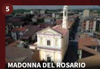
MADONNA DEL ROSARIO

Im Jahr 1619 wurde auf den Ruinen der Kirche San Giulio mit dem Bau der Kirche San Francesco und des Minoritenklosters begonnen. Die Fassade der Kirche ist ein Beispiel für die frühe, nüchterne Barockarchitektur. Im Inneren befindet sich ein wunderschön geschnitzter Holzaltar.