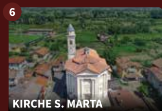
KIRCHE S. MARTA

Schon vor der Gründung des Borgo im Jahr 1242 befand sich an dieser Stelle eine antike, dem heiligen Benedikt geweihte Mönchszelle. Später wurde die heutige Kirche im Barockstil errichtet, die den Namen „Maria, Jungfrau und Königin des Heiligen Rosenkranzes“ erhielt. Die Fassade stammt aus dem Jahr 1688. Im Inneren, über einem prächtigen Altar aus schwarzem Marmor, befindet sich ein Triptychon, das Giovenone zugeschrieben wird.