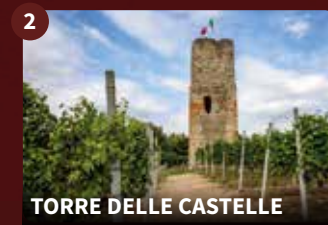
TORRE DELLE CASTELLE

Das dreischiffige romanische Gebäude wurde um 1470 abgerissen und an ihrem Standort eine vierschiffige spätgotische Kirche errichtet, von der heute noch die Fassade und die Basis des Glockenturms erhalten sind. Die heutige Kirche wurde 1881 mit neoklassizistischen Formen erbaut. Die Kuppel ist eine der ersten italienischen Konstruktionen aus verstärktem Ziegelstein.