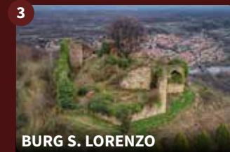
BURG S. LORENZO

Der massive Turm „Torre delle Castelle“ ist das Wahrzeichen der Stadt. Er wurde im 11. Jahrhundert errichtet und ist der sichtbarste Teil einer bedeutenden mittelalterlichen Festungsanlage. Von hier aus hat man einen herrlichen Blick auf den Monte Rosa und die Umgebung.